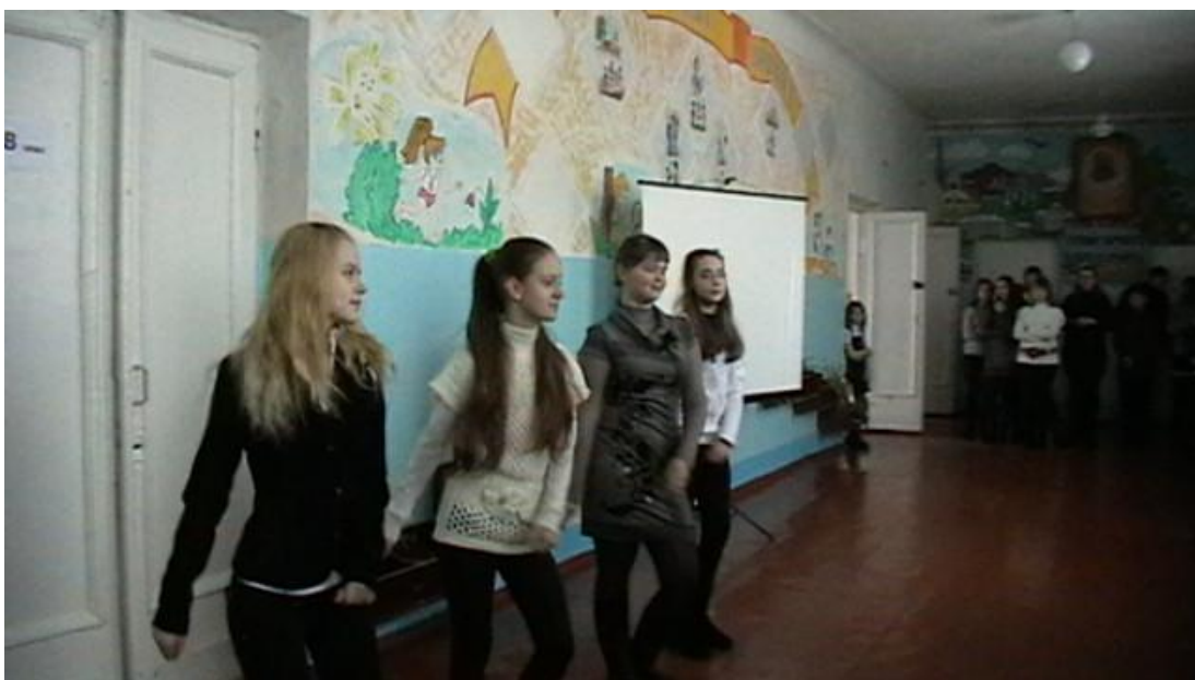
Загальношкільна лінійка « Зі святом Вас майбутні захисники Вітчизни»