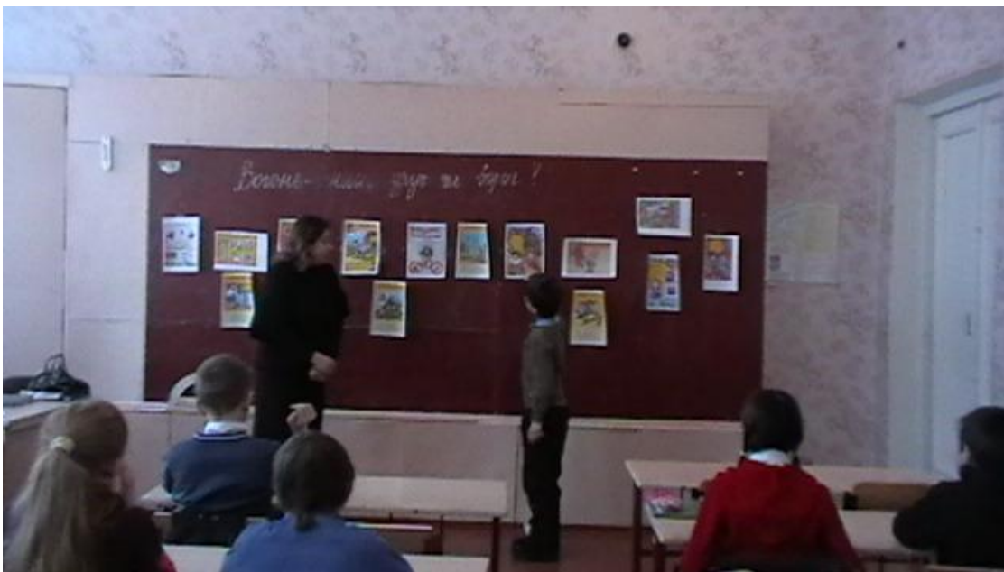
Виховна година для учнів 5 класу «Вогонь - наш друг чи ворог?»