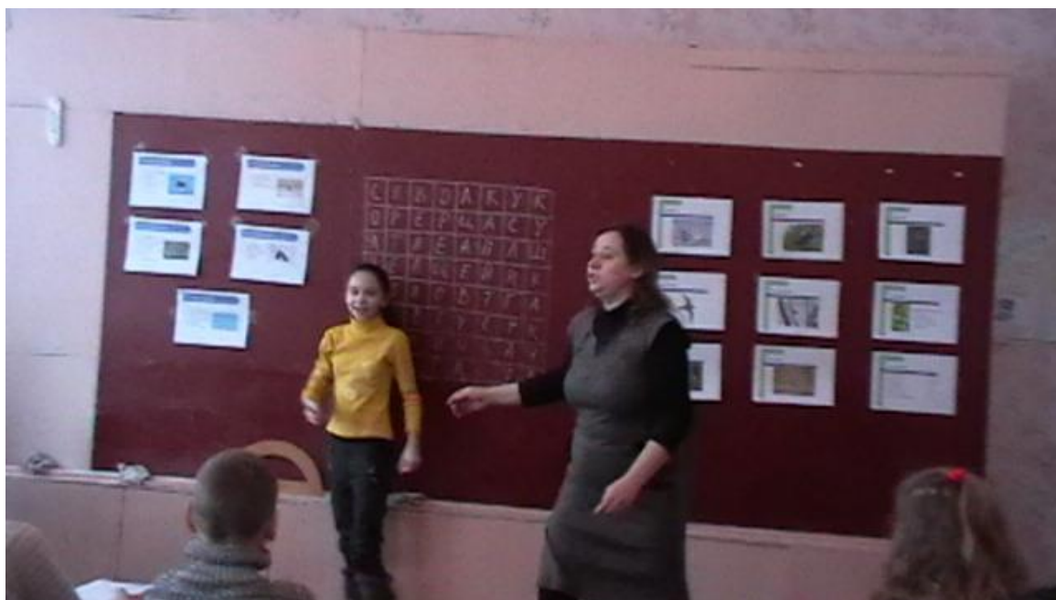
Виховна година для учнів 5 класу «Збережімо птахів»