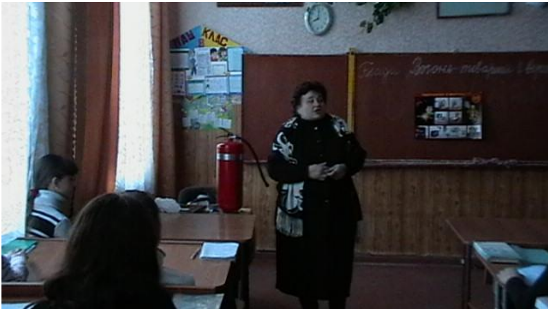
Виховна година для учнів 8 класу «Вогонь - товариш і ворог»