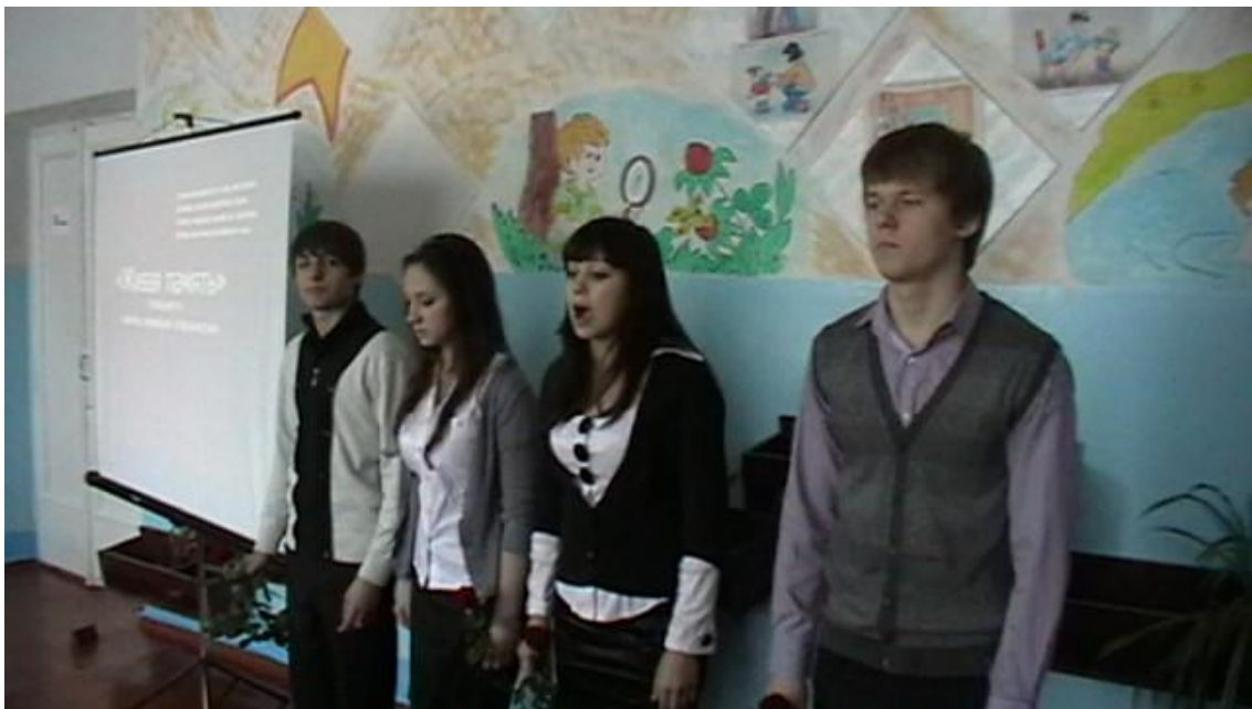
Лінійка, присвячена Дню виведення військ з Афганістану